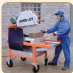
Mocna rama z 4 kółkami.