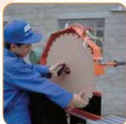
Łatwy dostęp do tarczy