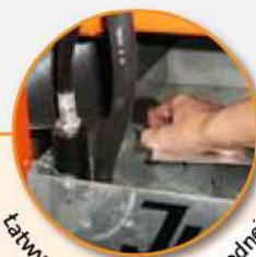
Łatwy dostęp do pompy wodnej