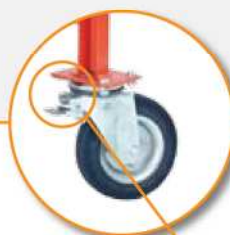
2 kółka z blokadą