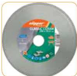
CLASSIC CERAM Ø 250 x 25,4 mm