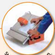
Stół pochylony (0° do 45°).