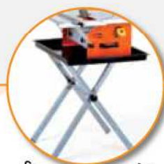
Składane nogi (opcja).