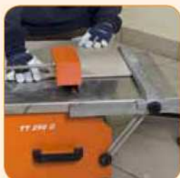
Błat ze stali nierdzewnej