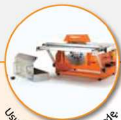
Usuwalny zbiornik na wodę.