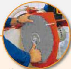
Łatwa zmiana tarczy.