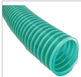
Wąż ssący PCV 2" / 50 mm