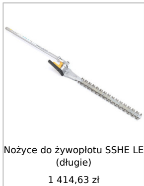
Nożyce do żywopłotu SSHE LE (długie) 1 414,63 zł