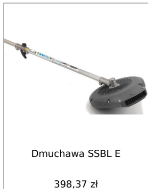
Dmuchawa SSBL E 398,37 zł