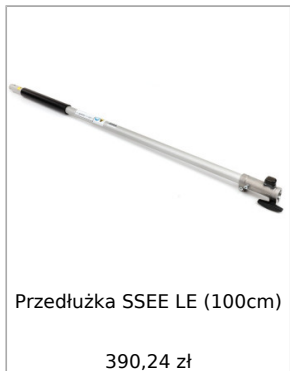
Przedłużka SSEE LE (100cm) 390,24 zł