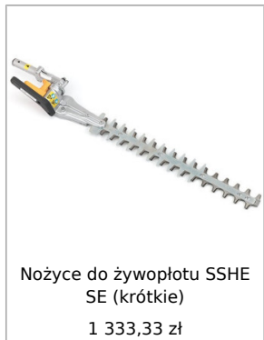
Nożyce do żywopłotu SSHE SE (krótkie) 1 333,33 zł