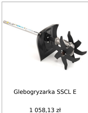
Glebogryzarka SSCL E 1 058,13 zł