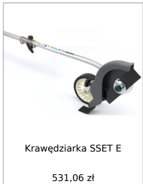
Krawędziarka SSET E 531,06 zł