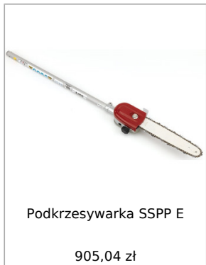
Podkrzesywarka SSPP E 905,04 zł