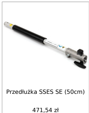
Przedłużka SSES SE (50cm) 471,54 zł