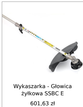
Wykaszarka - Głowica żyłkowa SSBC E 601,63 zł