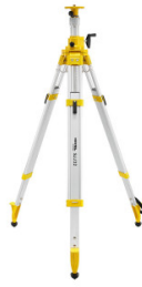
Aluminiowy statyw Nivel System SJJ32