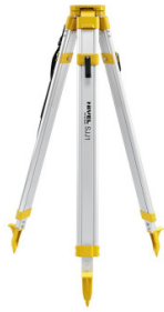
Aluminiowy statyw Nivel System SJJ1