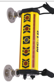
Czujnik maszynowy Nivel System MC-1D (syst...