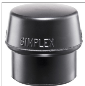
Guma do młotka brukarskiego SIMPLEX - Guma 21,17 zł