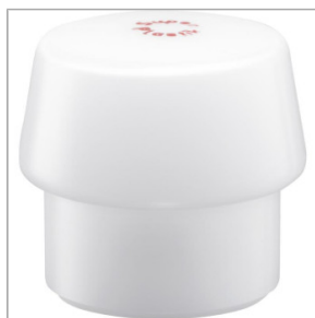
Guma do młotka brukarskiego SIMPLEX - Plastik 47,45 zł