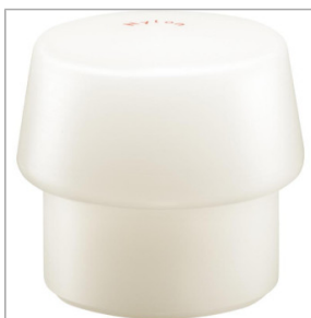
Guma do młotka brukarskiego SIMPLEX - Nylon 51,10 zł