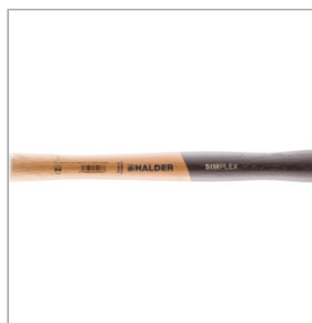
Trzonek młotka brukarskiego SIMPLEX 36,08 zł