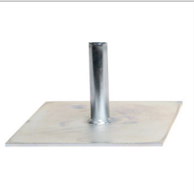
Stopa do listwy zgarniającej Jazon