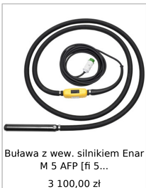
Buława z wew. silnikiem Enar M 5 AFP [fi 5... 3 100,00 zł