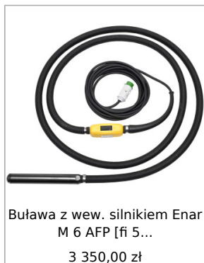
Buława z wew. silnikiem Enar M 6 AFP [fi 5... 3 350,00 zł