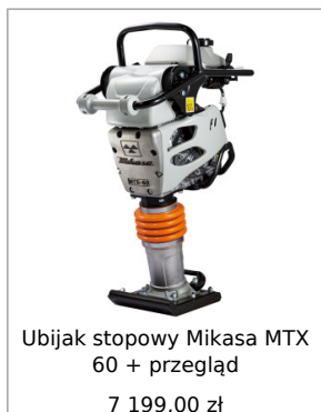
Ubijak stopowy Mikasa MTX 60 + przegład 7 199,00 zł