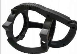
Uchwyt, rączka Enar DINGO