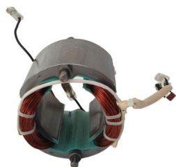
Stojan Enar DINGO