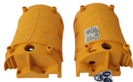
Obudowa plastikowa Enar DINGO