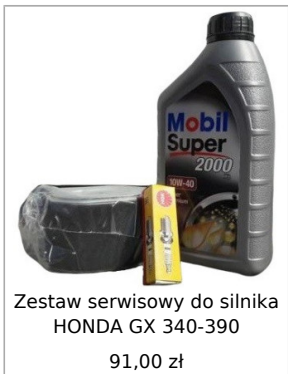
Zestaw serwisowy do silnika HONDA GX 340-390 91,00 zł