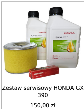
Zestaw serwisowy HONDA GX 390 150,00 zł