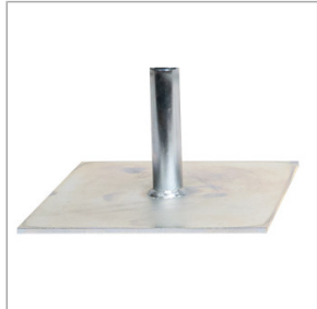
Stopa do listwy zgarniającej Jazon