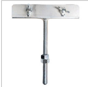
Siodło do listwy zgarniającej Jazon