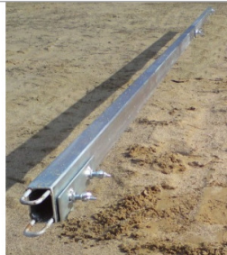
Szyna 3m do listwy zgarniającej Jazon