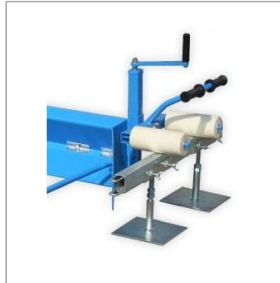
Części do łąty zgarniającej Jazon