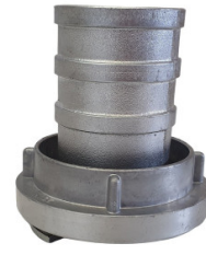
Łącznik ssawny 2"/3"