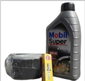
Zestaw serwisowy do silnika HONDA GX120