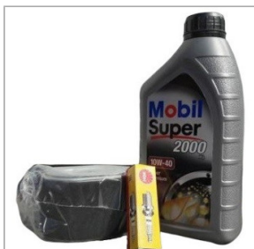
Zestaw serwisowy do silnika HONDA GX160