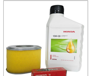
Zestaw serwisowy HONDA GX 160