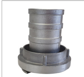
Łącznik ssawny 2"/3"