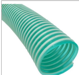
Wąż ssący PCV 3" / 75 mm