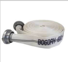
Wąż tłoczny strażacki 3" / 75 mm [dł. 20m]