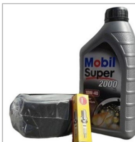
Zestaw serwisowy do silnika HONDA GX160