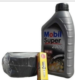
Zestaw serwisowy do silnika HONDA GX160