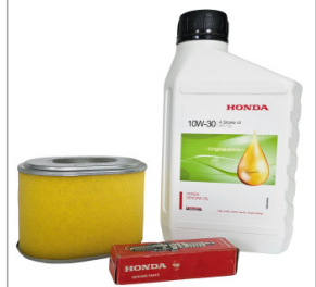
Zestaw serwisowy HONDA GX 160