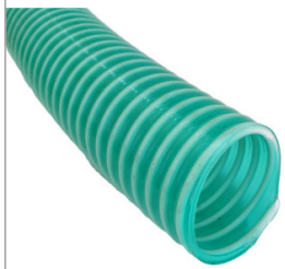
Wąż ssący PCV 2" / 50 mm