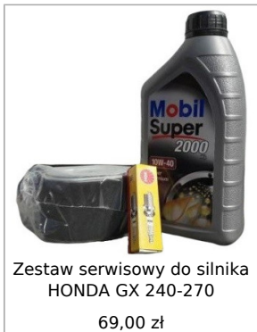
Zestaw serwisowy do silnika HONDA GX 240-270