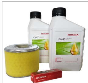
Zestaw serwisowy HONDA GX 390 150,00 zł