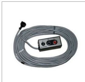
Zdalne sterowanie 1 731,18 zł