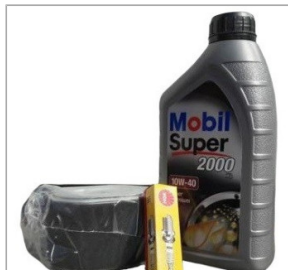
Zestaw serwisowy do silnika HONDA GX 340-390 91,00 zł