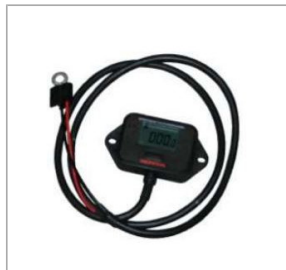
Licznik motogodzin 420,00 zł